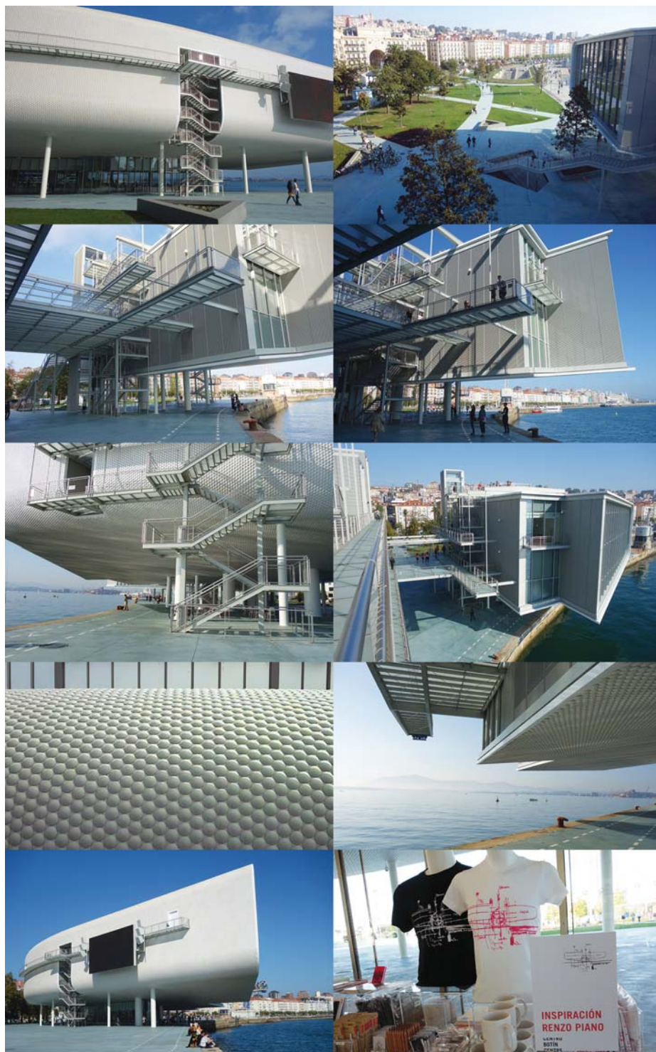
Il. 2. Santander, Centrum Botín proj. Renzo Piano; fragmenty bryły, detale architektury i marketing.