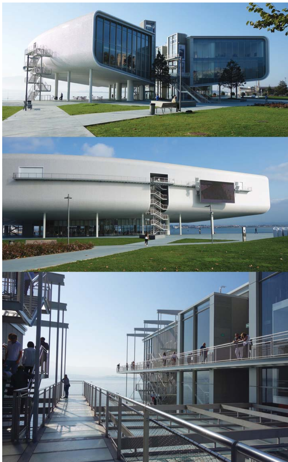
Il. 1. Santander, Centrum Botín proj. Renzo Piano.