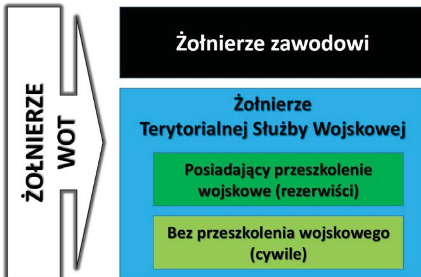
Ryc. 2. Podział żołnierzy WOT ze względu na posiadane przeszkolenia wojskowe

a ukierunkować szkolenia na praktykę (w tym przede wszystkim zintegrowane szkolenie taktyczne oraz szkolenie strzeleckie).