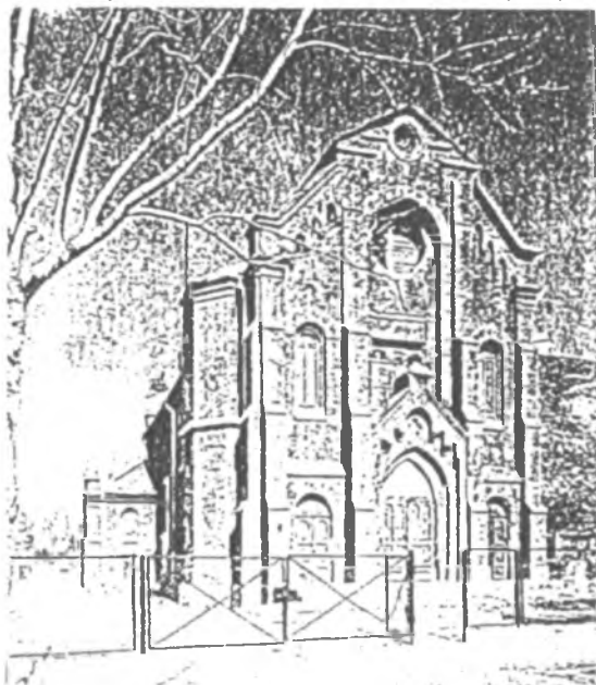
Kościół w Tobolsku – 1995 r.

W 1815 r. ze względu na wielki obszar parafii, misja podzieliła się na dwie części: jedna została w Irkucku przejmując Syberię Wschodnią, a druga za