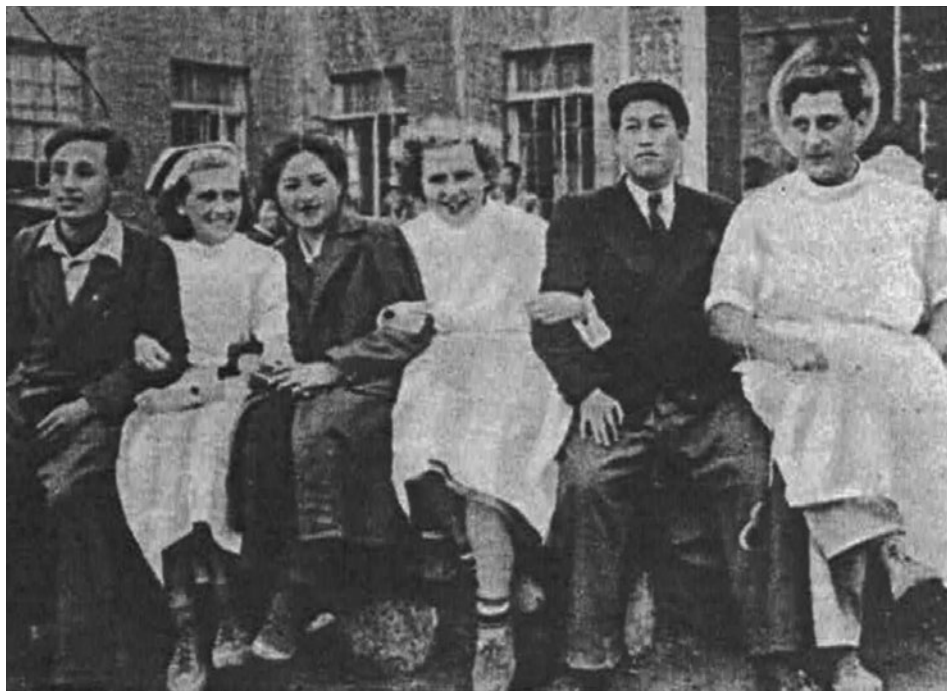
Rycina 3. Polscy i koreańscy pracownicy szpitala.