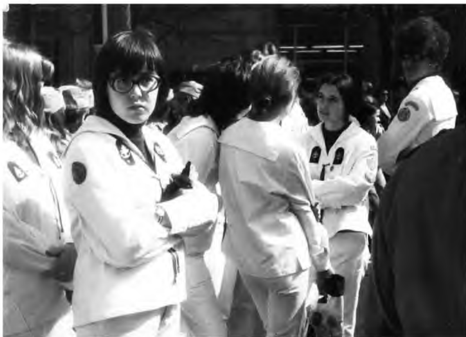
Fot. 3. Harcerki i harcerze w oczekiwaniu na przemarsz w pochodzie pierwszomajowym, 1970 r.