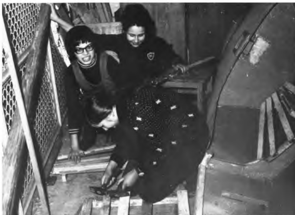
Fot. 12. Harcerki 79 WZDH przy pracach szkutniczych

Budowa Simpli była zadaniem dla najbardziej zaawansowanych szkutników drużyny. Wszyscy natomiast mogli brać udział w budowie łódek wiosłowo-żaglowych. Zachowało się trochę zdjęć, na których widać jak młode, piękne dziewczyny z wdziękiem używały wszelkich narzędzi stolarskich, jednak głównie papieru ściernego. Analizowano plany projektów, wycinano potrzebne elementy wyposażenia, klejono je, skręcano, obrabiano i malowano. Zajęcia te odbywały się, oczywiście, po obowiązkowych lekcjach. Warunkiem udziału w nich był brak zaległości szkolnych.