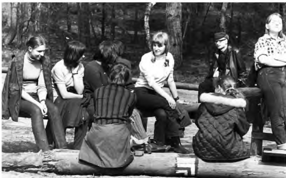
Fot. 6. Niedzielny rajd do Kampinosu, 1970 r.