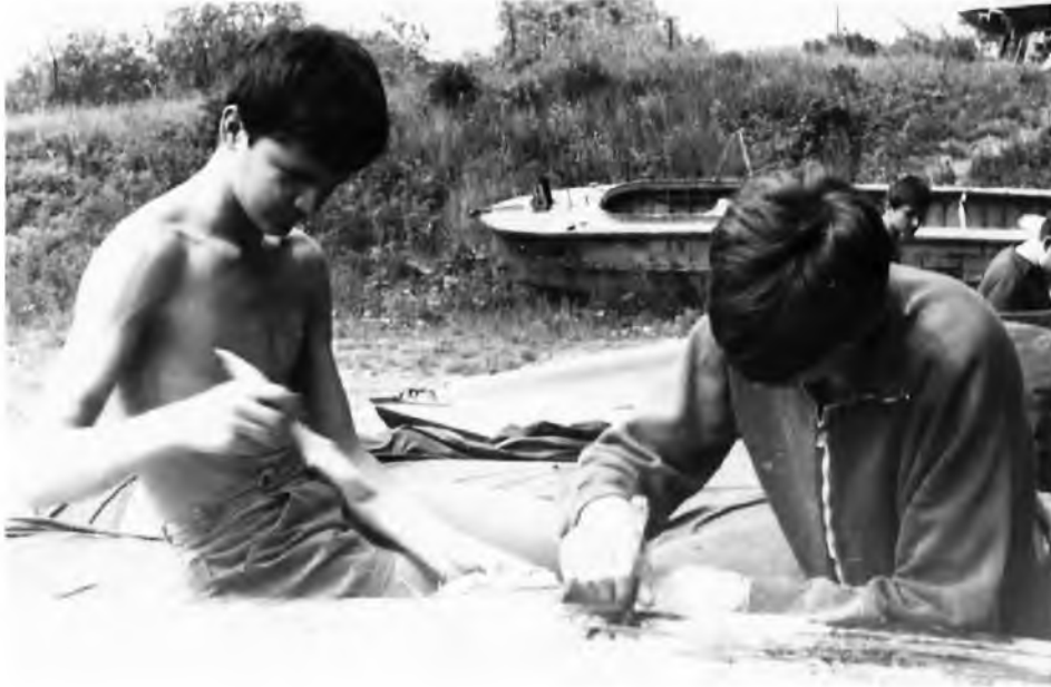
Fot. 11. Harcerze 79 WZDH przy pracach skutniczych

konduktorów. Skończyło się na transporcie ręcznym, czyli przeszliśmy ze stępką pieszo kilka kilometrów.