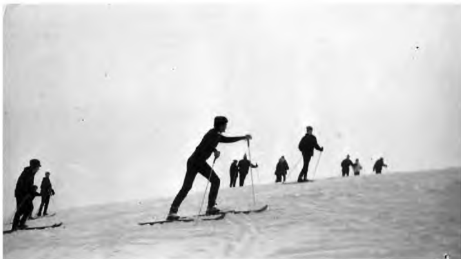
Fot. 4. Zajęcia narciarskie na zimowisku w Ropkach, 1971 r.