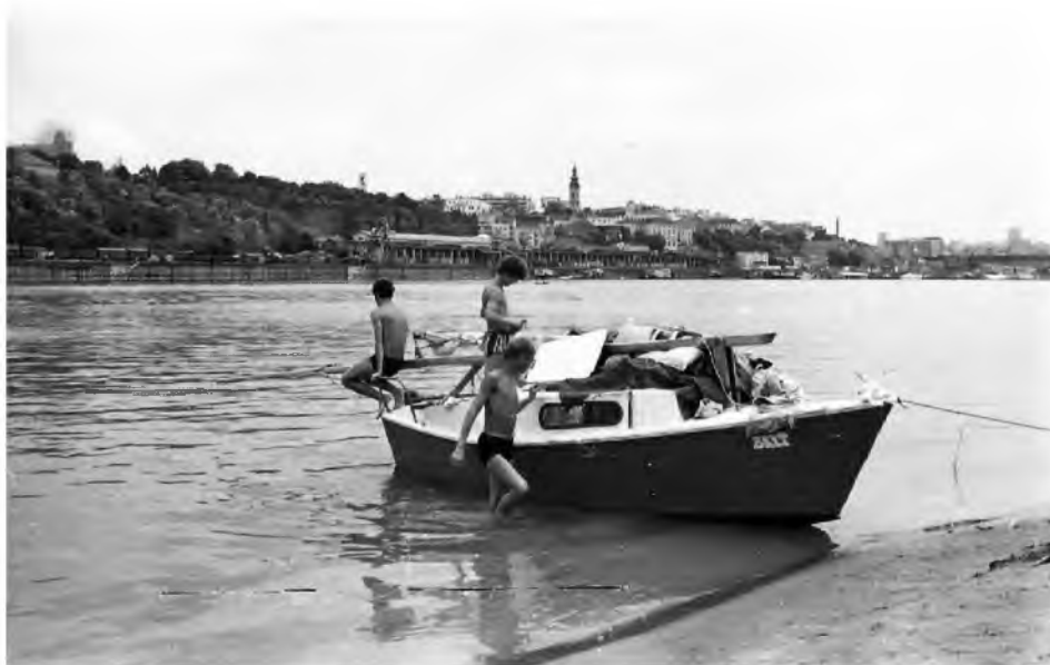
Fot. 5. Harcerska żaglówka typu Simple s/y „Belt”, rejs Dunajem 1970 r.

dzinnych narad w gronie ścisłej kadry. W większości były to właściwe wybory, a wielu kapitanów łodzi z rejsów Dunajem jest nadal czynnymi żeglarzami.