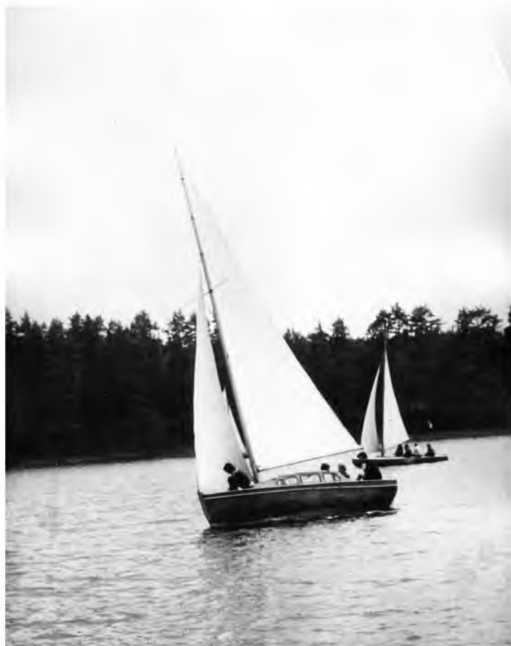
Fot. 7. Okabinowana morska szalupa s/y „Sebastian” w rejsie mazurskim, obóz Karwica 1972 r.

wspomnieniami, zamieszczamy zdjęcia. Wielu z nas nadal żegluje, jeździ na nartach i słucha muzyki poważnej.