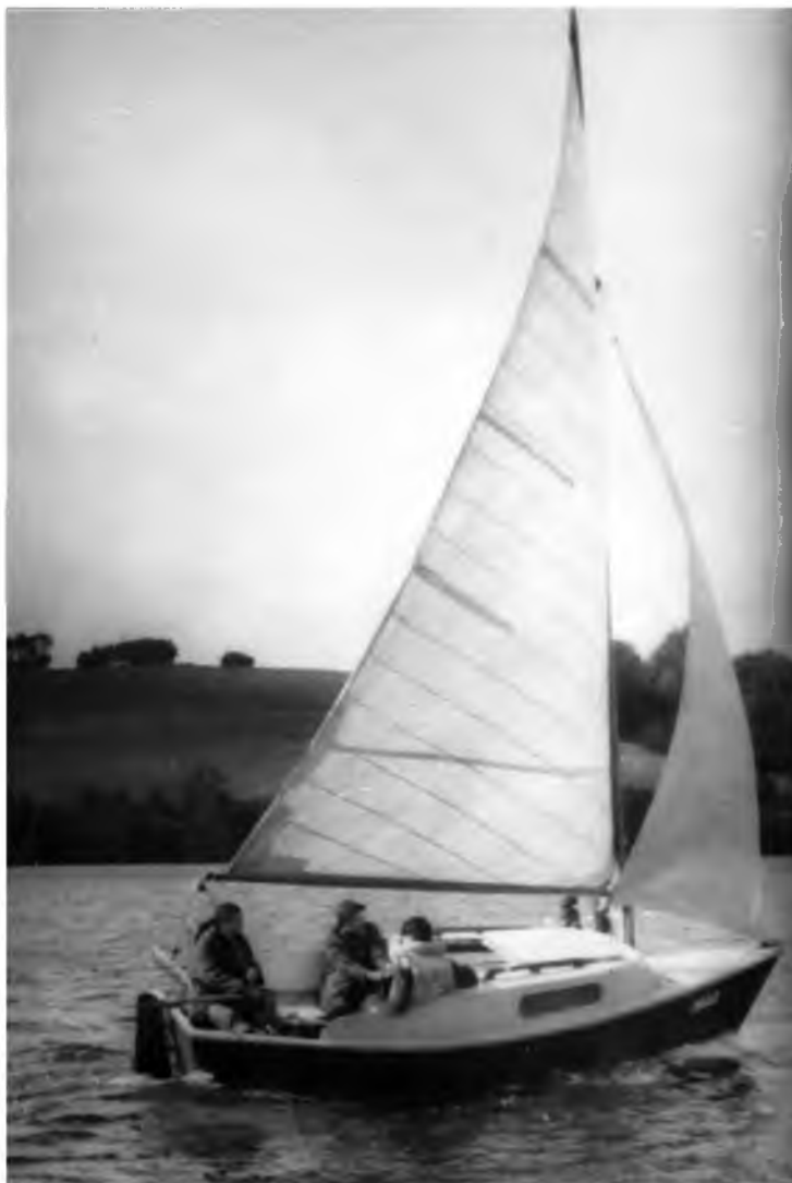
Fot. 13. S/y „Belt” w mazurskim rejsie

W pierwszy rejs popłynęliśmy na mazurskie Śniardwy i tam mogliśmy przekonać się o swoich zdolnościach skutniczych. Poczuliśmy wtedy wspaniałą satysfakcję i wiedzieliśmy, że wypełniliśmy zobowiązania.