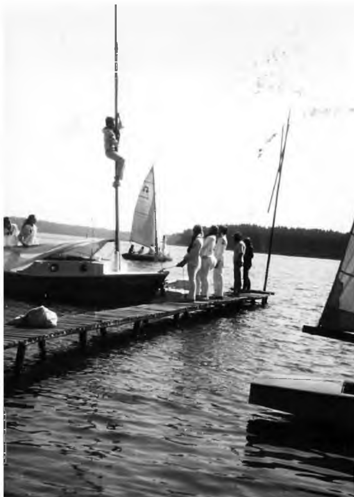
Fot. 14. Żaglówka typu Simple s/y „Hańcza” cumuje do pomostu, obóz Karwica 1972 r.

Ponieważ były to obozy żeglarskie, ważnym zadaniem było wybudowanie pomostów, do których przybijaly łodzie żaglowe naszej drużyny. Musiały one wytrzymać ciężar wielu chodzących po nich żeglarzy, jak i nie zawsze udane ćwiczenia manewru podchodzenia łodzi do pomostu.