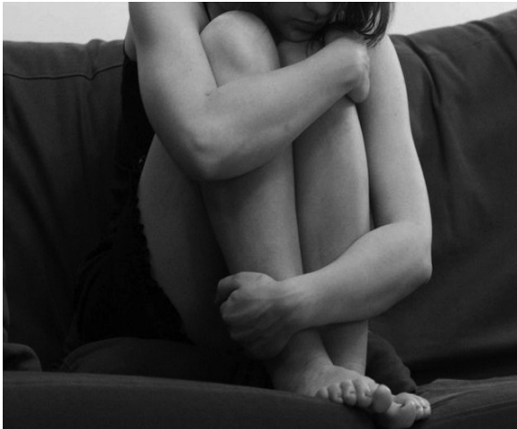
Photograph 1:

The other side emphasised opinions on fixed position of a woman in the society and the necessity to normalise previously culturally approved behaviours. Differences in approach to the subject can be already seen after reading titles and phrases used in texts, as they fulfil the whole message in order to intensify or to weaken its result. It is also worth mentioning the considerable freedom in constructing titles in the Internet, as well as selecting photographs used to illustrate specific articles, although these photographs were not subject to separate analysis, and those presented below should only be considered as example of their utilisation.