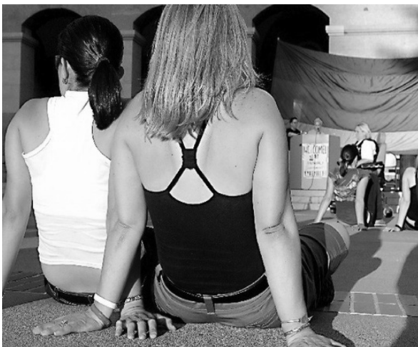
Zdjęcie 2:

Zadaniem mediów w dyskursie na temat spraw społecznie ważkich, takich jak dokumenty ds. równości i zapobiegania agresji wobec kobiet, czy ogólnie rzecz ujmując – przemocy domowej, jest budowa świadomości społecznej. I choć nie myliła się Paulina Wiśniewska, zauważając, że „tematyka równouprawnienia jest nieustannie obecna w mediach i [...] zmienia w efekcie stereotypowe, utrwalone tradycją społeczną myślenie o kobietach” 102 , należy skonstatować, że owa obecność nie jest równo-