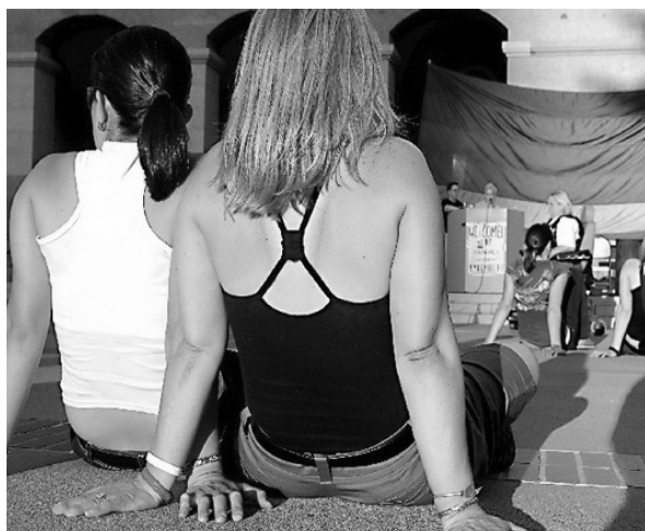
Photograph 2