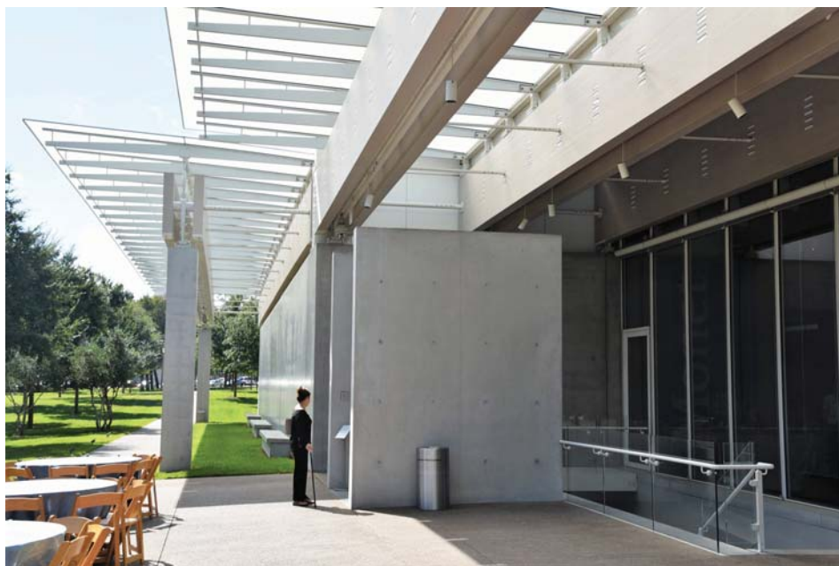
Il. 13. Wejście główne do pawilonu Piano.