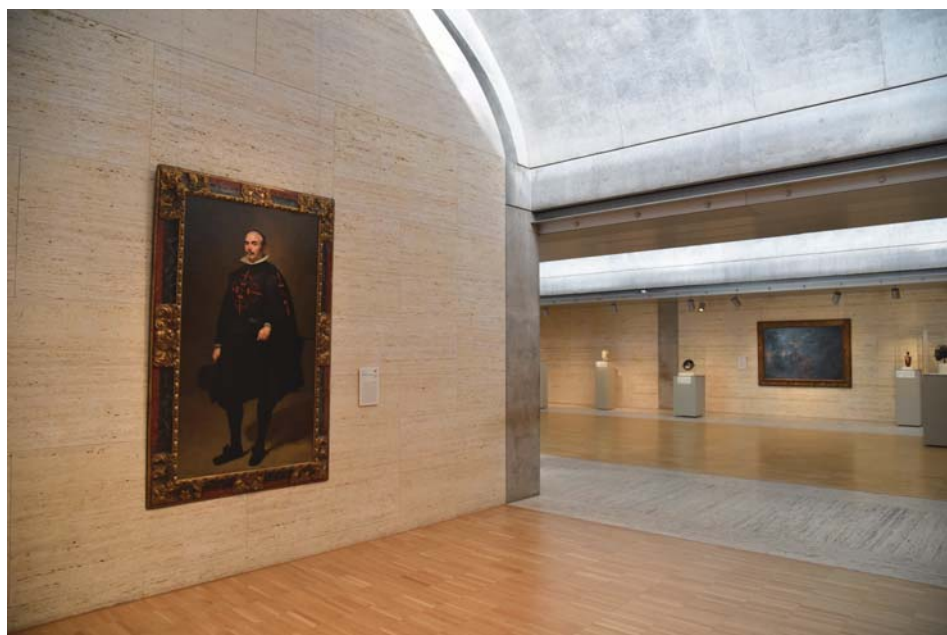
Il. 9. Wnętrze Kimbell Art Museum, na pierwszym planie portret Don Pedro de Barberana Diego Velázquez, ok. 1631–1633.