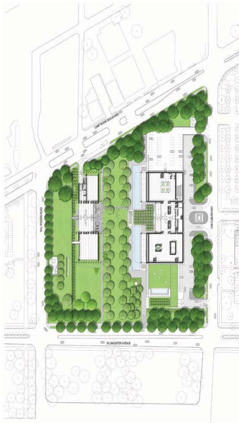
Il. 10. Plan sytuacyjny: po prawej budynek Louisa Kahna, po lewej pawilon Renzo Piano.