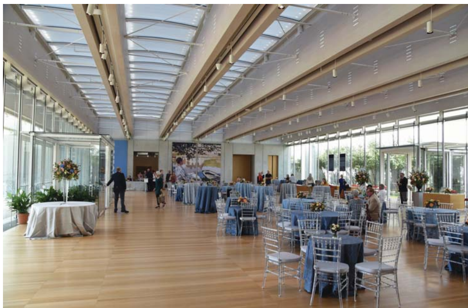
Il. 14. Hall wejściowy w pawilonie Piano w głębi galeria wystaw czasowych, po prawej przejście do audytorium – trwają przygotowania do wernisażu wystawy czasowej Claude'a Moneta.