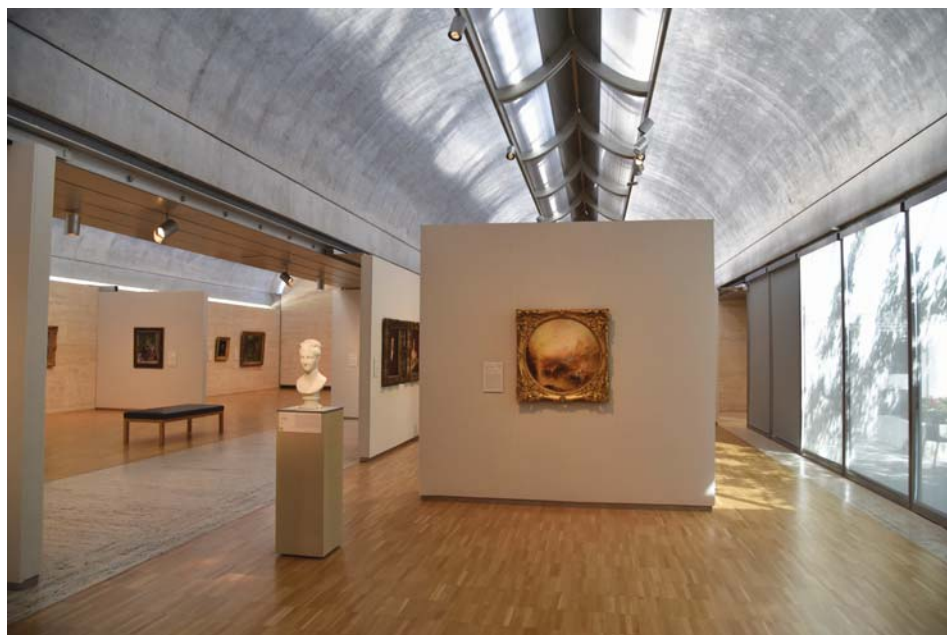
Il. 8. Kimbell Art Museum: wnętrze galerii.