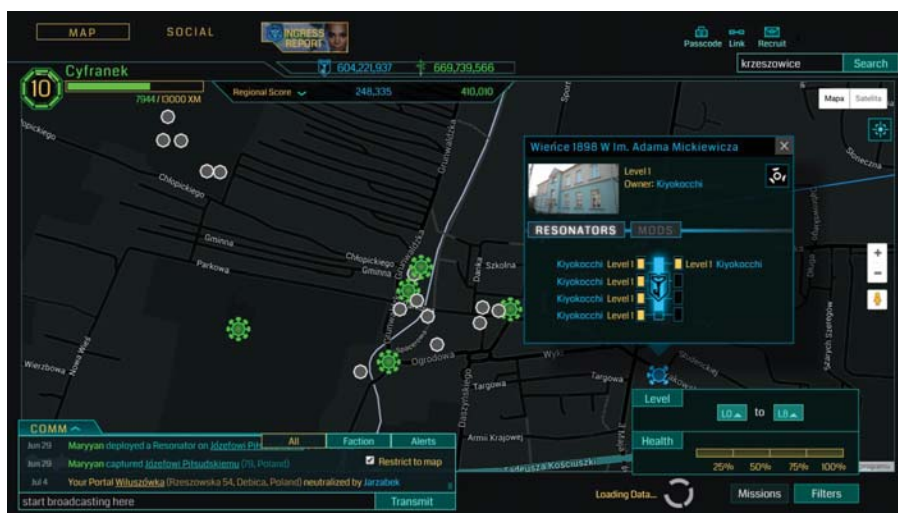
Ryc. 2. Plansza gry Ingress na terenie miasta Krzeszowice