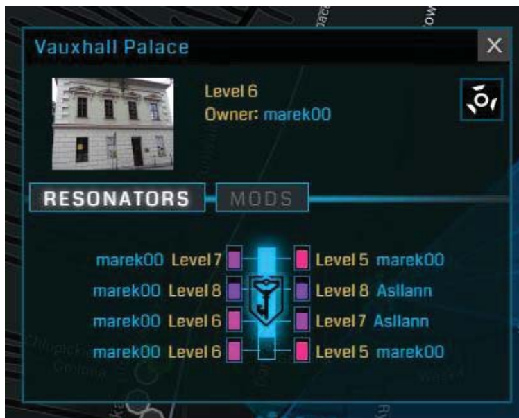
Ryc. 3. Pałac Vauxhall na wirtualnej mapie gry Ingress